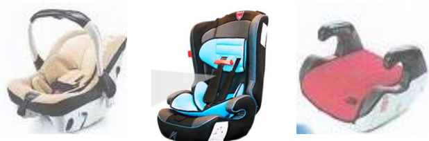
Автолюлька Автокресло Бустер