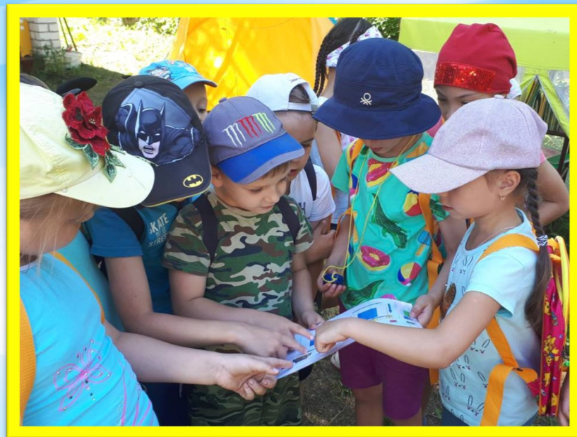
Схема-карта для проведения квеста на воздухе