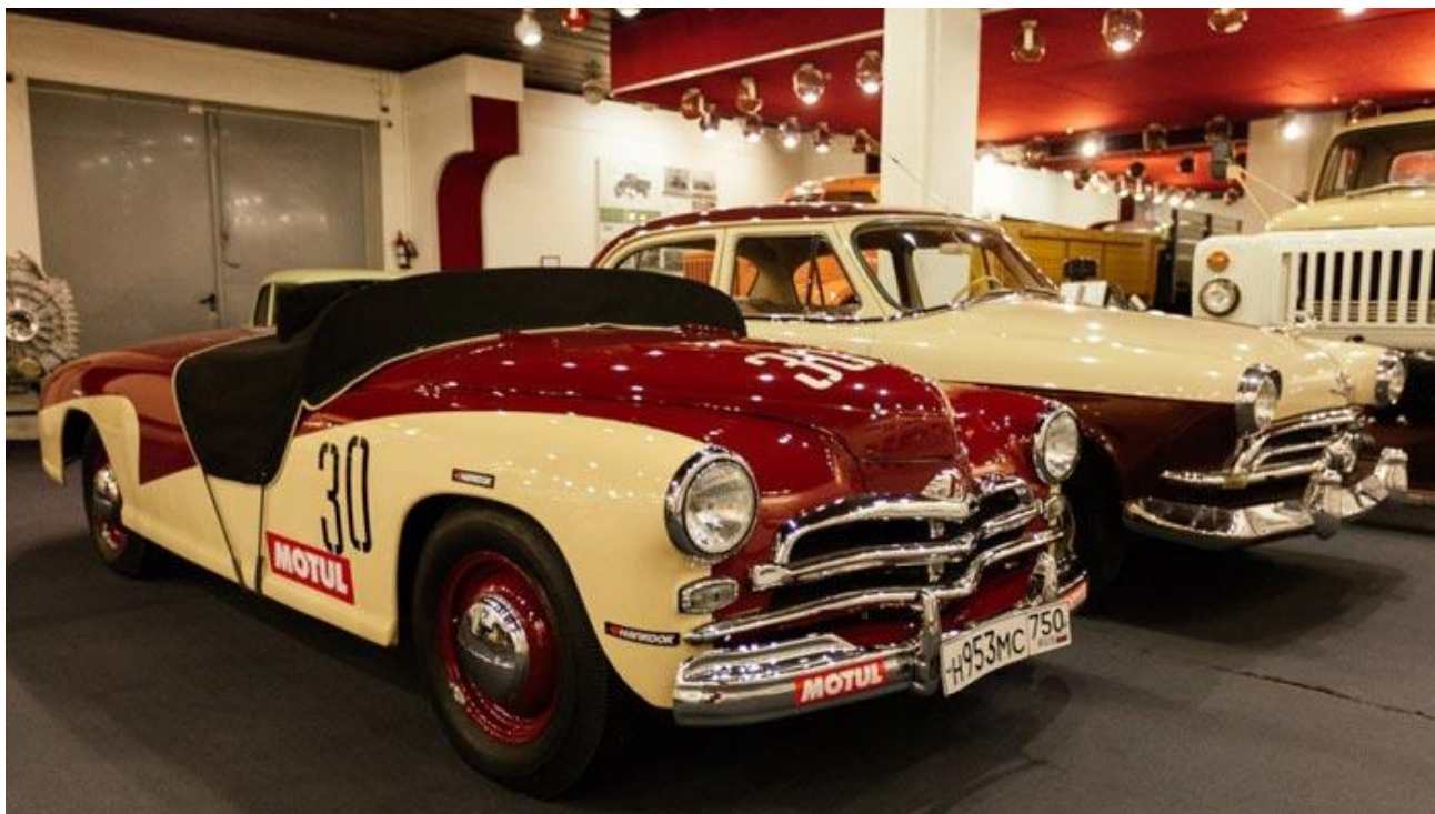
Раритетные экспонаты нижегородского Музея ГАЗ.

Для детей школьного возраста будут интересны многочисленные музеи под открытым небом, но эти мероприятия скорее подойдут мальчикам. Некоторые из них находятся на Нижегородской Стрелке. Музей истории ГАЗ Музей истории ГАЗ (пр.Ленина, 95) это заводской музей, где можно воочию увидеть легендарные «Чайку» и «Победу», а также ознакомиться с другими ГАЗами и военной техникой.