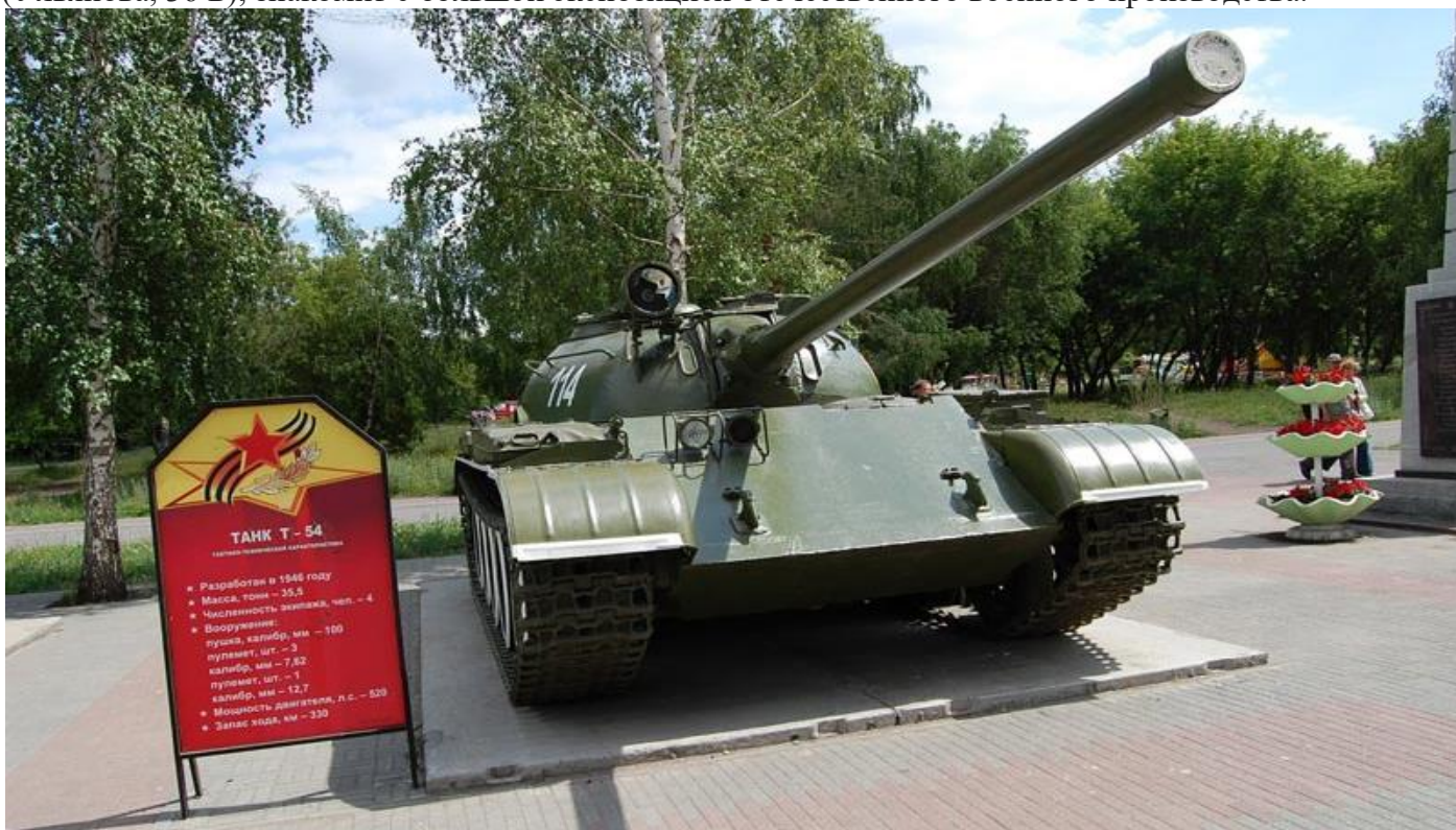
Военные экспонаты Парка Победы.

Нижегородский музей техники и оборонной промышленности Этот музей под открытым небом (Ульянова, 36 Б), знакомит с большой экспозицией отечественного военного производства.