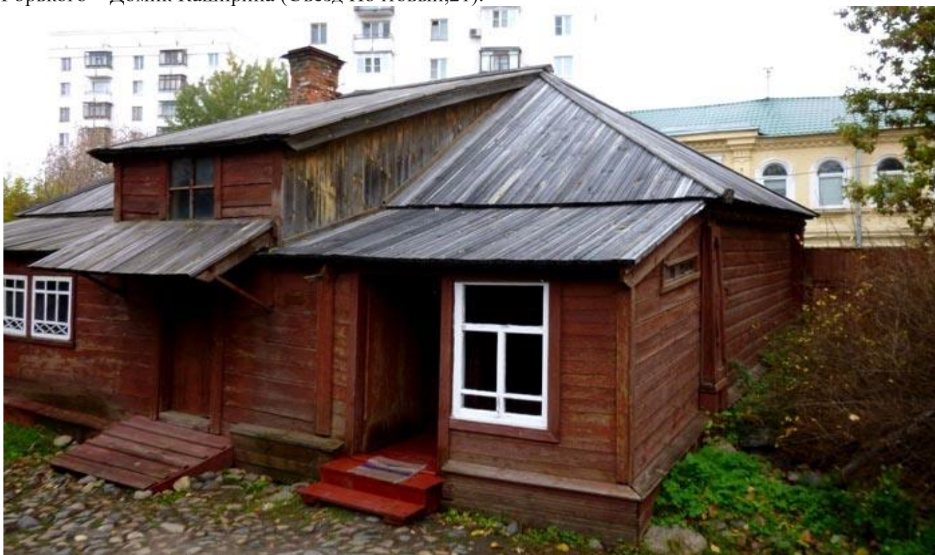
Домик Каширина. Вид со двора.

Домик Каширина. Из музейного знакомства с городом очень рекомендуем сводить детей в музей Горького – Домик Каширина (Съезд Почтовый,21).