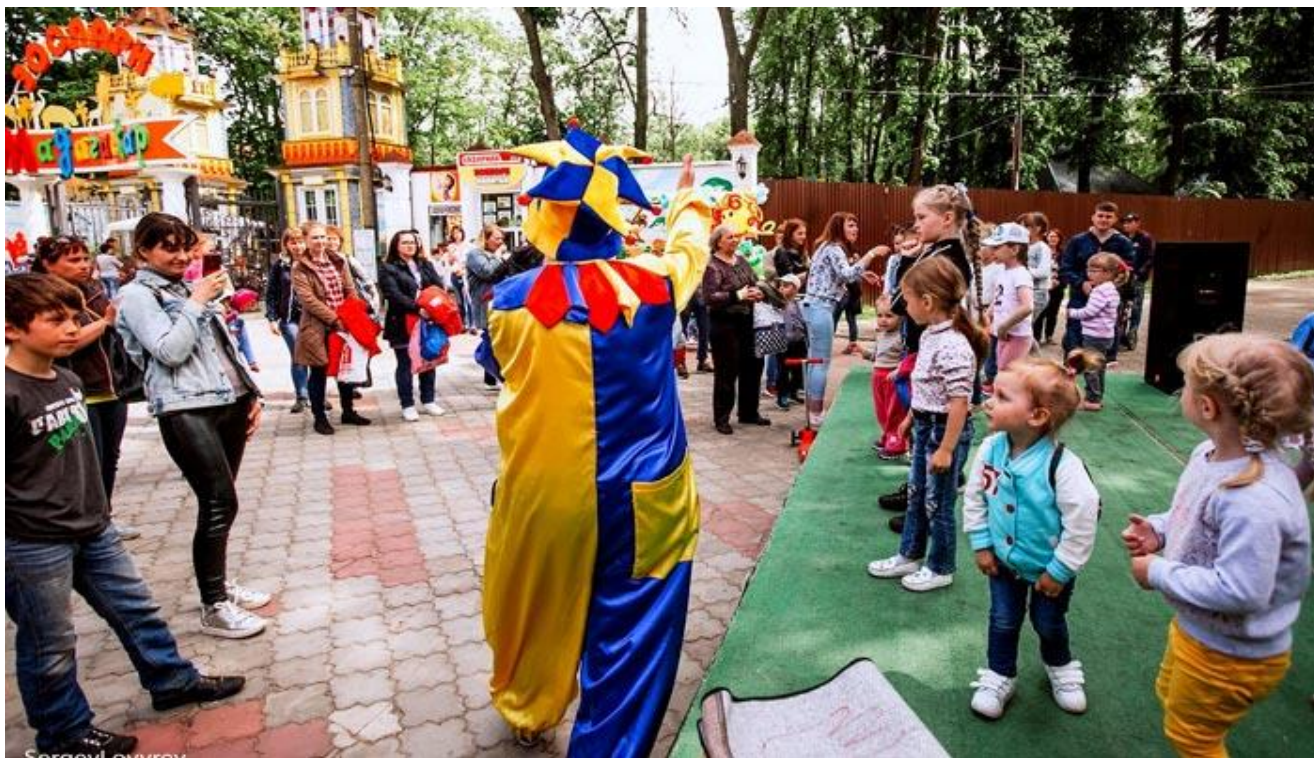
Веселое времяпровождение в Сормовском парке.

На 3-4 часа, а то и на целый день, можно занять детей, посетив с ними замечательные нижегородские зоопарки «Лимпопо» и «Мадагаскар» (Ярошенко, 7 Б), находящийся на территории Сормовского парка культуры и отдыха (Нижегородская Стрелка). С Площади Минина и Пожарского туда ходят маршрутки. Посещение сормовских зоопарков будет приятно и вам и детям – животные хорошо ухожены и очень милы. А после зоопарка, можно погулять по самому Сормовскому парку, поразвлечься на аттракционах и отдохнуть в аквапарке «Карибы», посетить летний Дельфинарий, посидеть в парковых беседках и подышать лесным воздухом.