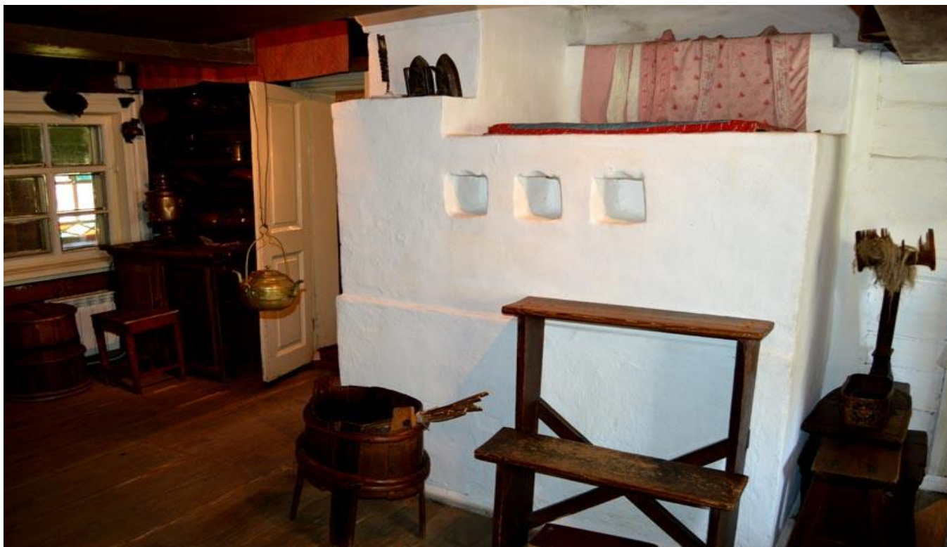
Бытовая атмосфера в Домике Каширина.

Это домик бабушки Алеши Пешкова, где мальчик провел несколько лет своего полусиротского детства, которое позднее, став писателем Максимом Горьким, описал в своей повести «Детство». Даже если ваш ребенок еще не знаком с этим произведением, посмотреть дореволюционный быт, в котором жили дети всего чуть более ста лет назад очень интересно. Ведь современный ребенок даже представить не может, что раньше дети стали на полатах, для чего предназначены розги и многое другое.