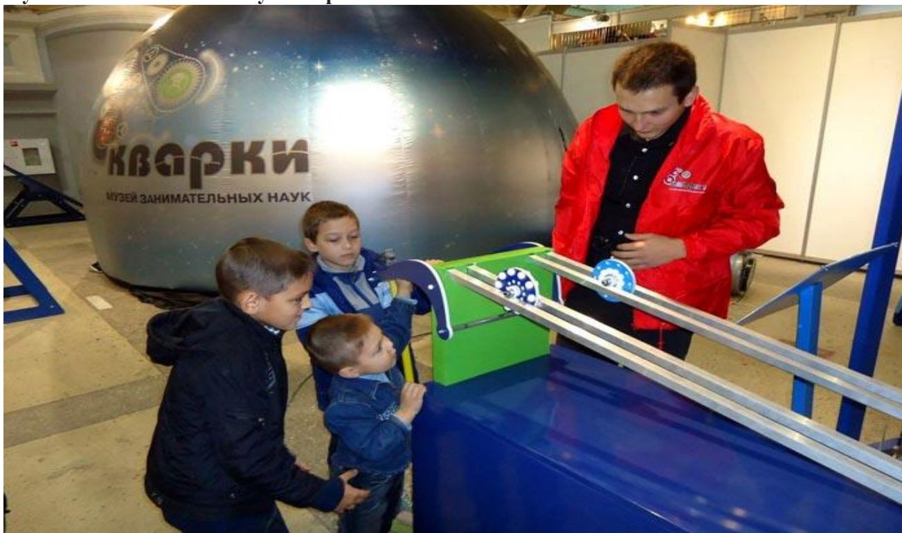
Единение родителей и детей в Музее "Кварки".

Со школьниками интересно будет сходить в нижегородский Музей занимательных наук «Кварки» (Родионова, 165), рассчитанный как раз на детскую возрастную клиентуру. «Кварки» - это зона свободного детского саморазвития, где дети сами проводят эксперименты, познают законы физики в игровой форме, много бегают и наблюдают за тем, как их родители на их глазах превращаются в любознательных детей.