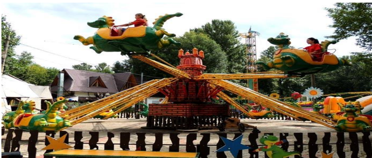
Развлечения в Парке 1 мая.

В Парке 1 мая также можно провести незабываемый день. Здесь кроме Детской железной дороги и Дельфинариума, есть всевозможные аттракционы, парк приключений «Таинственный остров», множество кафе, гриль-домик и т.д. А зимой здесь работает самый лучший каток «Северное сияние», горки и лыжи.