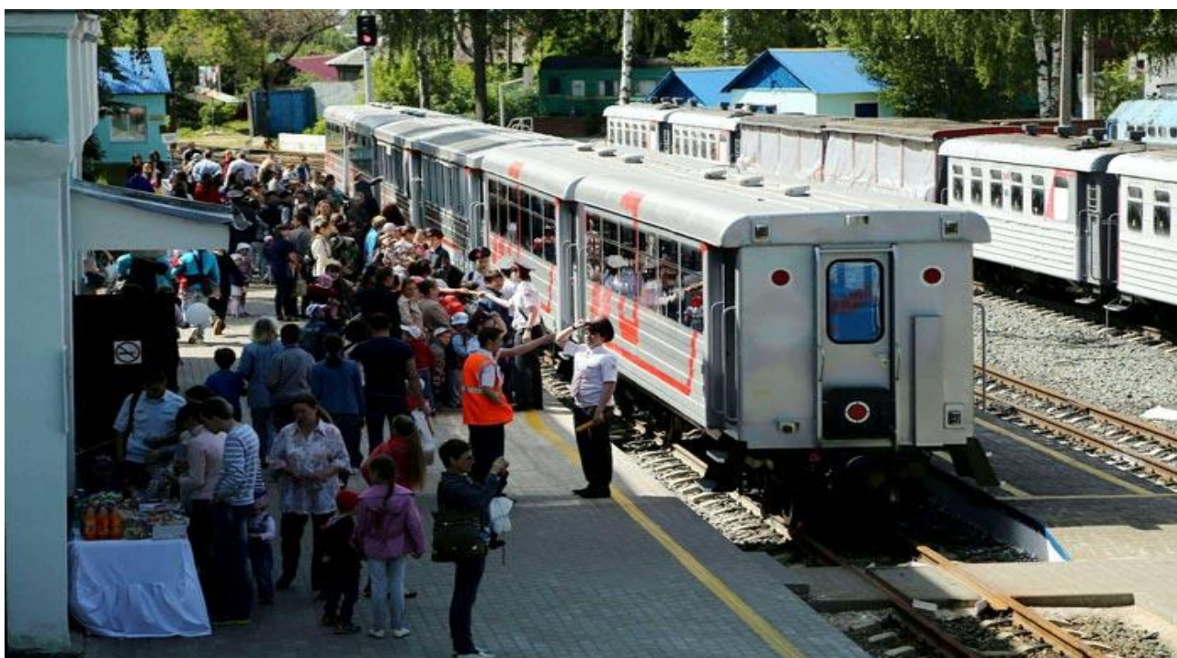
Порадуйте детей - совершите поездку на Детской железной дороге

Недалеко от Дельфинария, также в парковой зоне, находится Детская Железная дорога.