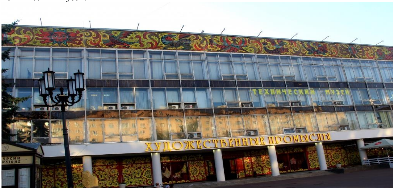
Здание двух музеев - Технического и Истории народных промыслов.