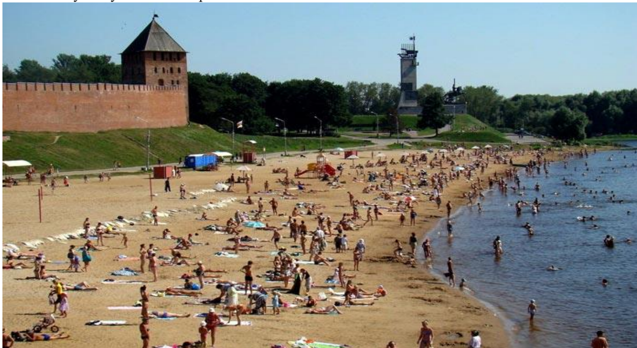
Отдых на городском нижегородском пляже.

Летом также можно ходить с детьми на многочисленные городские пляжи - купание в Волге ничем не хуже купания на море.