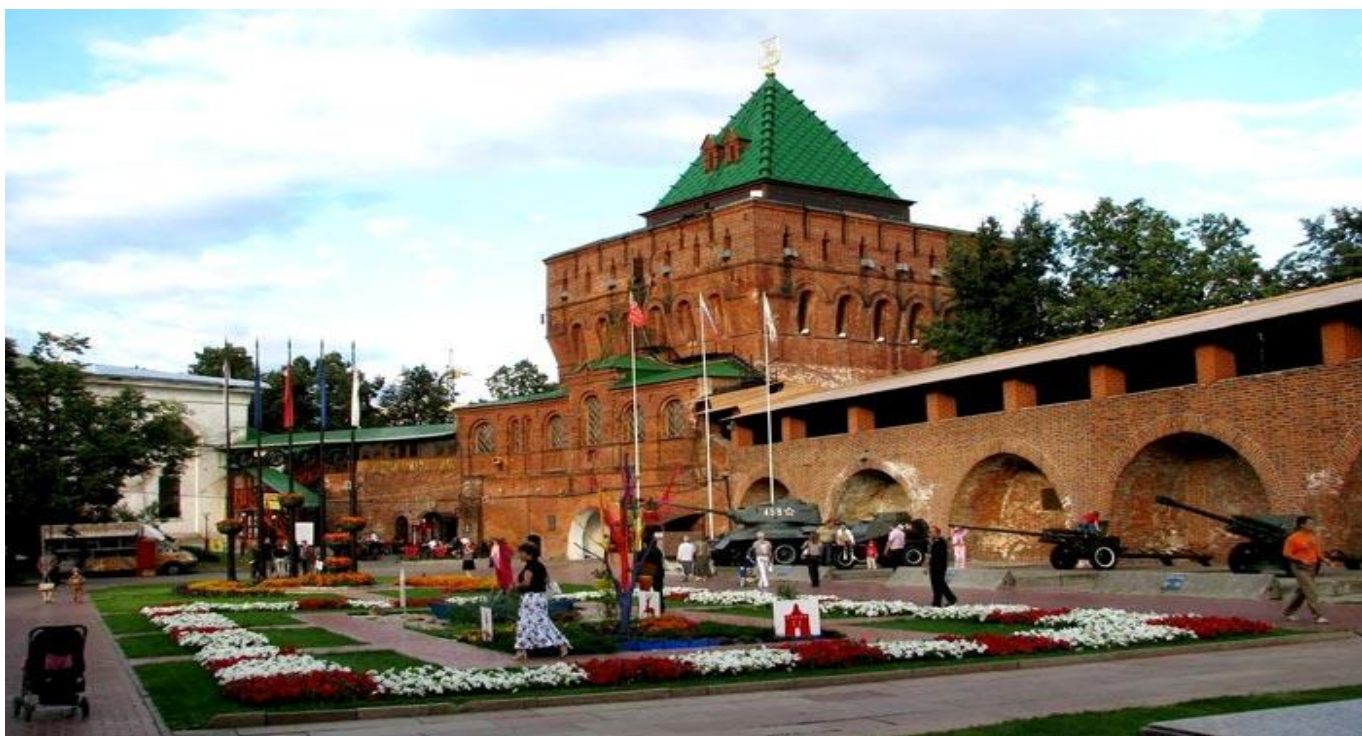
Выставка "Горьковчане - фронту!" около Дмитриевской башни.

Около Зачатьевской башни интересно осмотреть древние стенобитные и прочие орудия, применение которых непосвященному человеку очень сложно понять.