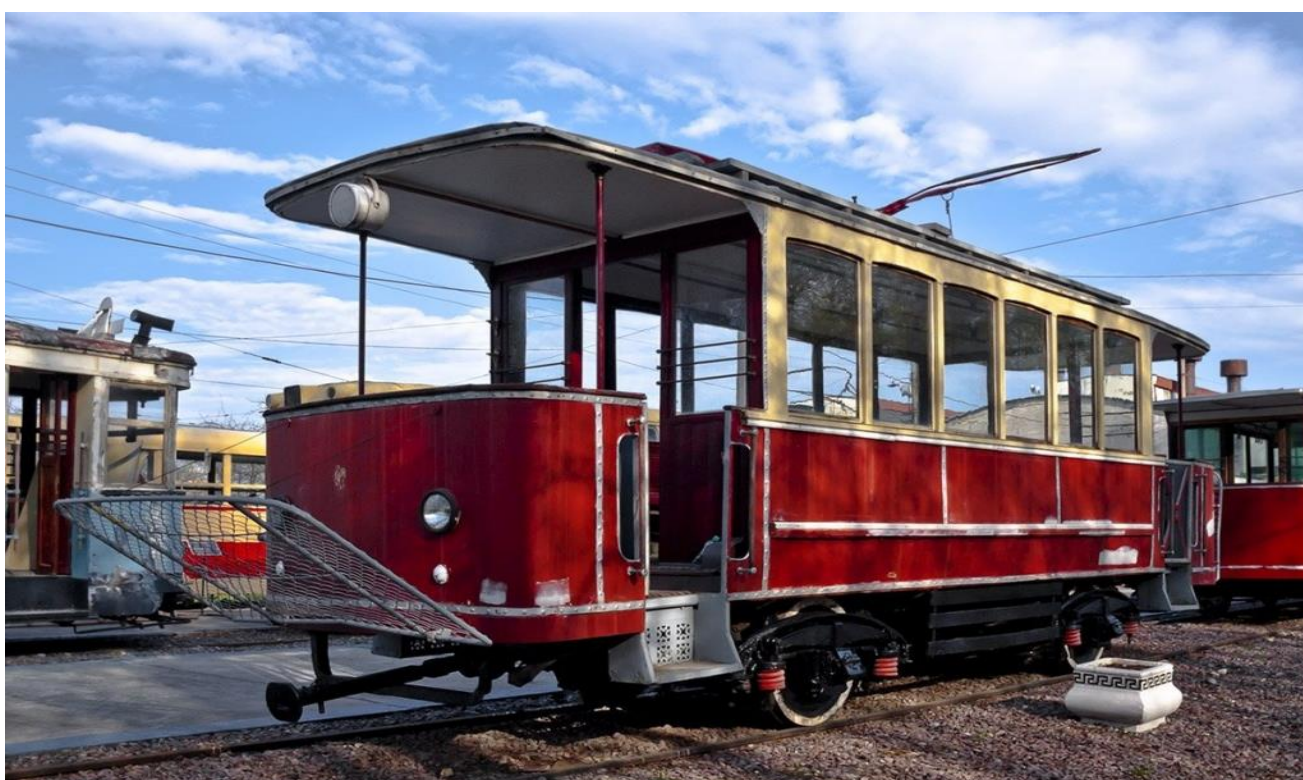
Экспонаты Музея истории Нижегородэлектротранса.