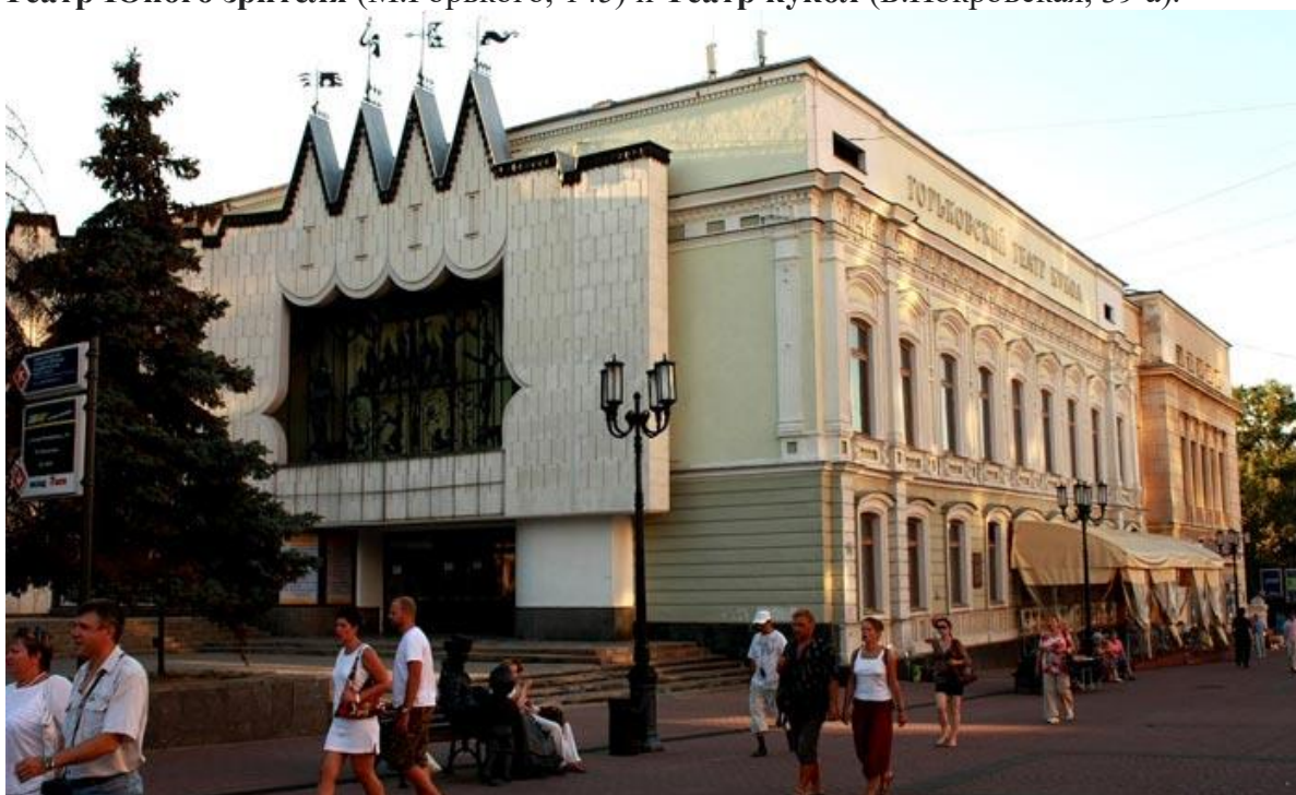
Нижегородский Театр кукол находится Большой Покровской улице.

Прежде всего – это детские театры. Для молодых зрителей в городе работают традиционные Театр Юного зрителя (М.Горького, 145) и Театр кукол (Б.Покровская, 39 а).