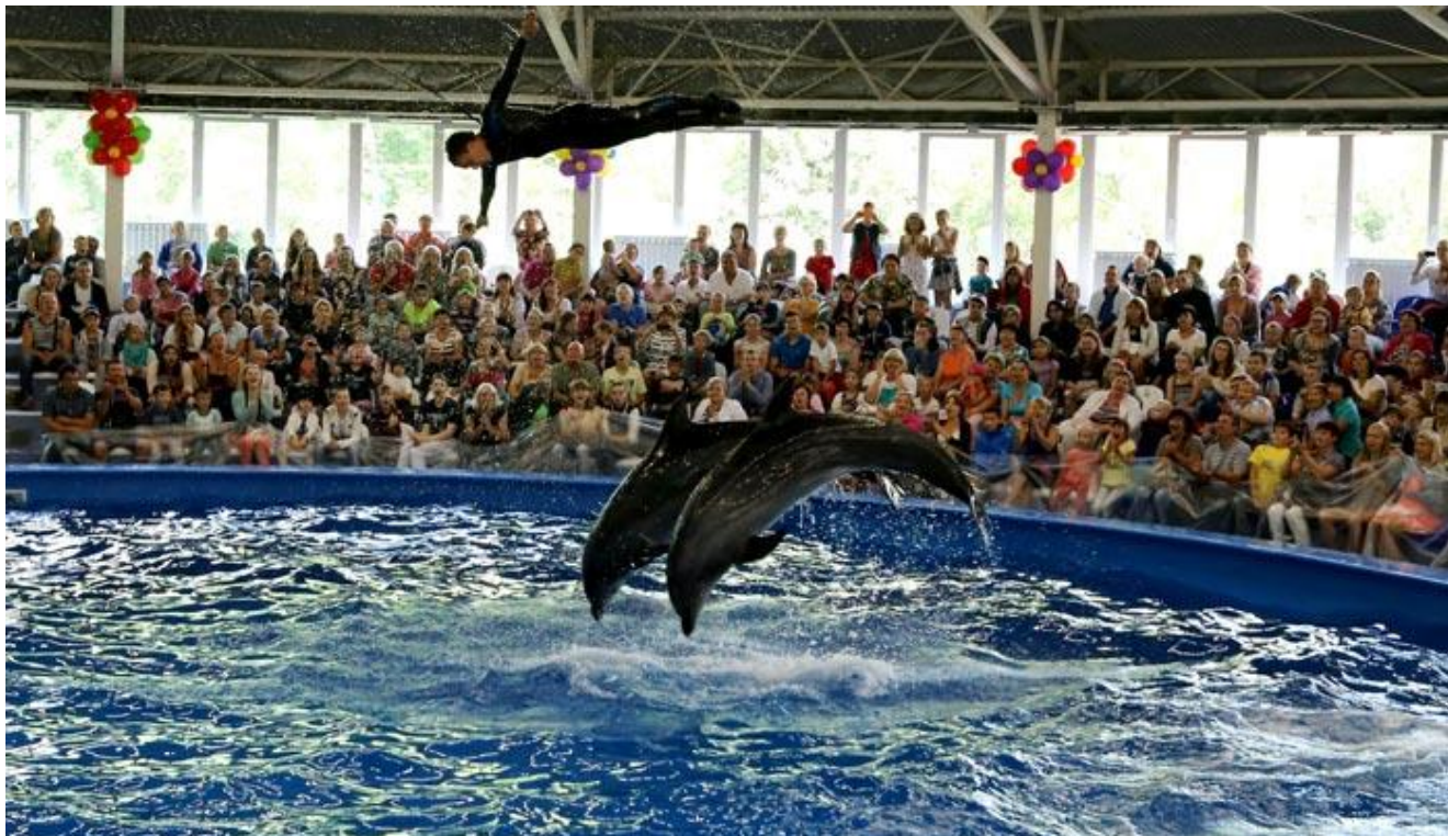
Представление в Дельфинарии Парка 1 мая.

Так же на территории Нижегородской Стрелки находится нижегородский Дельфинарий (ул. Октябрьской революции, 1), который расположился в другом парке - Парке 1 мая. Этот Дельфинарий, в отличие от Сормовского работает и зимой и летом.