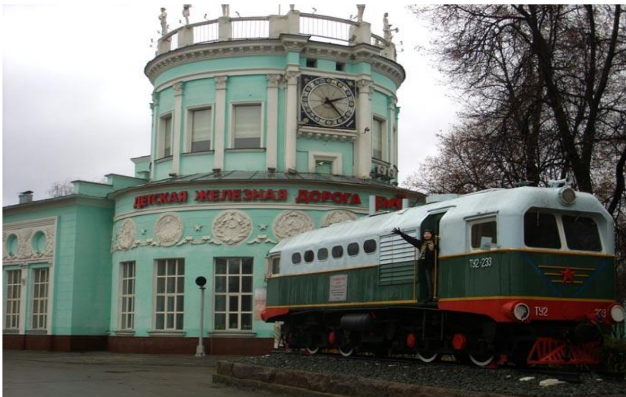
Станции Детской железной дороги - образцы сталинского конструктивизма.

возраста, которые приобщаются ко взрослой жизни в подобной увлекательной форме. Вашим детям будет полезно увидеть как их сверстники, или дети чуть постарше, выполняют вполне взрослые обязанности. Интересно, что эта Детская железная дорога была построена аж в 1939 году! И ее конечные станции, сооруженные первоклассными архитекторами того времени как образцы сталинского конструктивизма, просто поражают своим парадно-дворцовым видом.