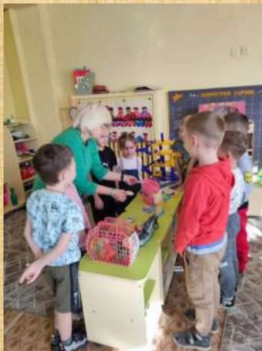
Фото отчет о занятии «Развитие познавательного интереса и математического мышления дошкольников в подготовительной группе.