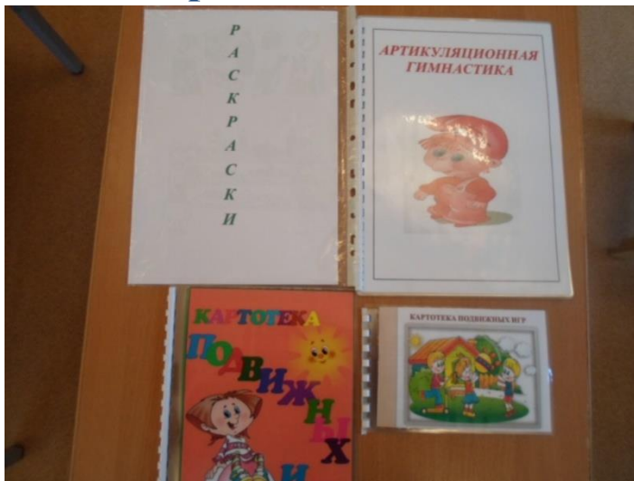
Картотеки гимнастик, подвижных игр, раскраски