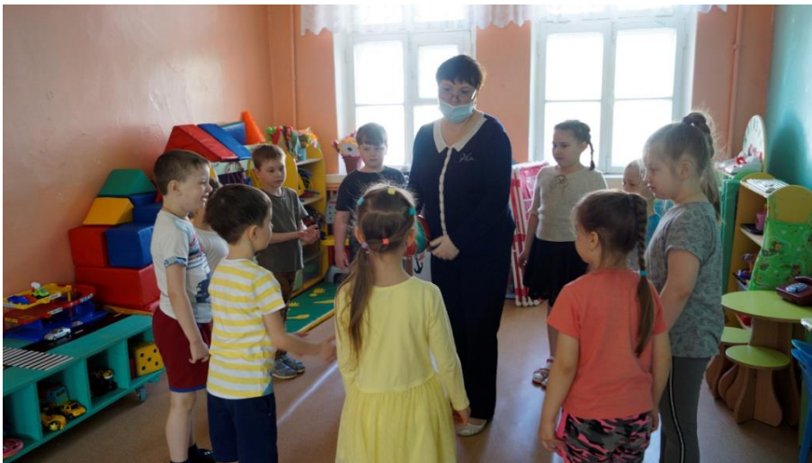
➤ Динамические паузы