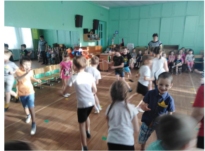
➤ Подвижные игры