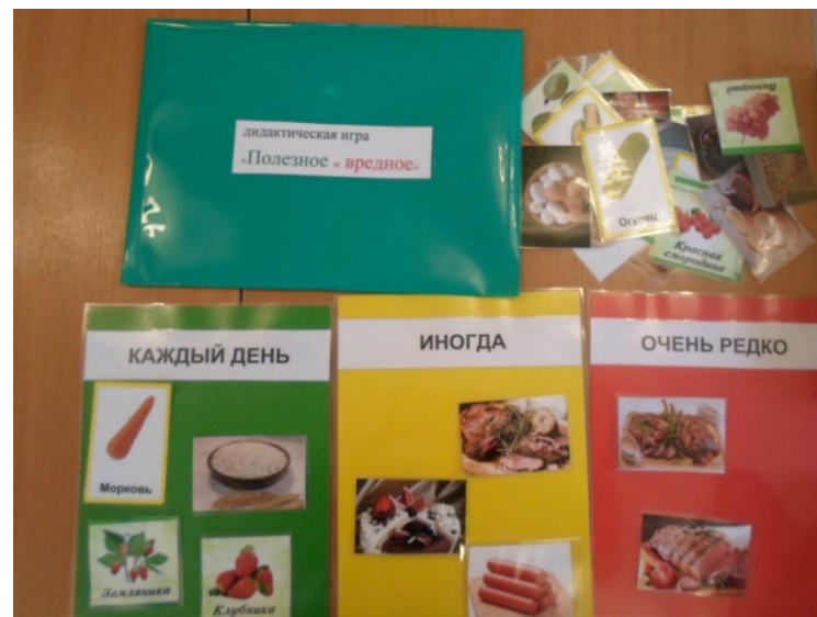
«Полезное и вредное»