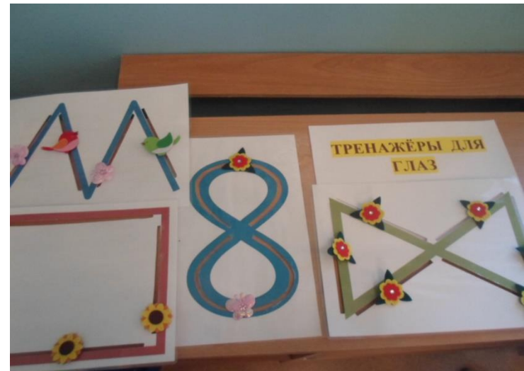
Тренажеры для глаз