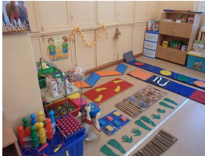
Лепбук «Чемодан здоровья»