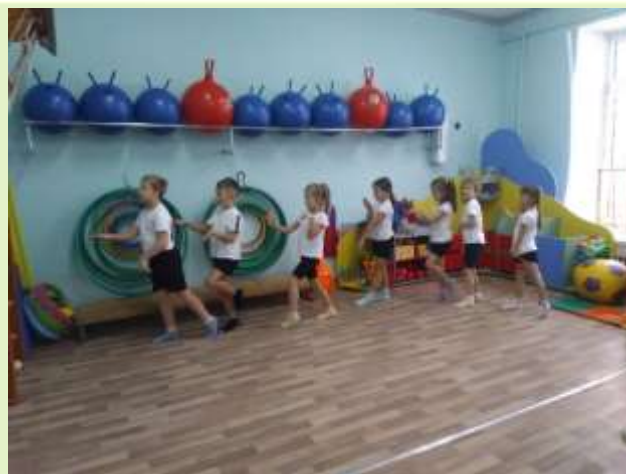
Идем как «лисички»