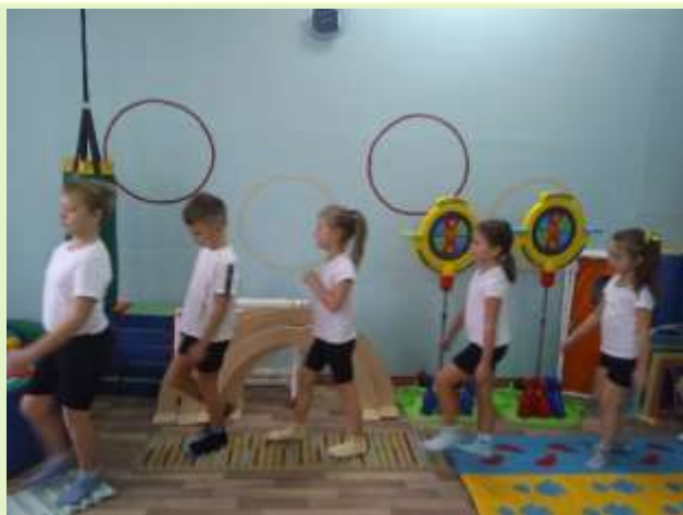
Ходьба по ребристой дорожке