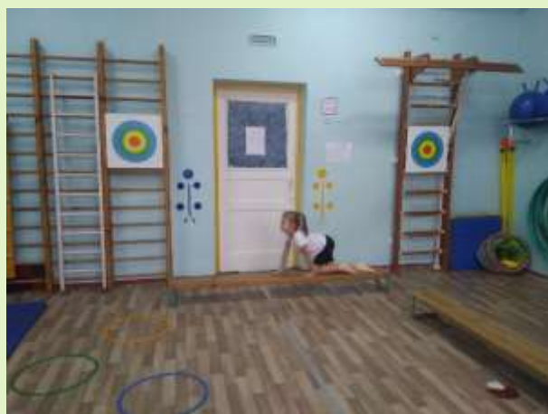
Ползаем как «медвежата»