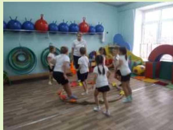
Подвижная игра «Не попадись»