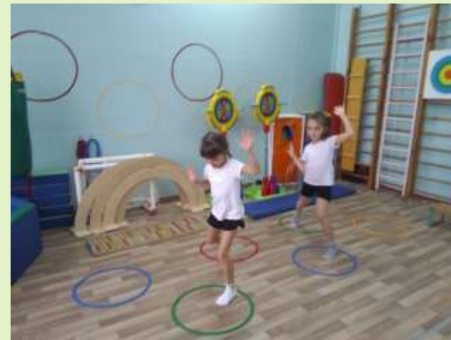
Прыгаем как «лягушата»