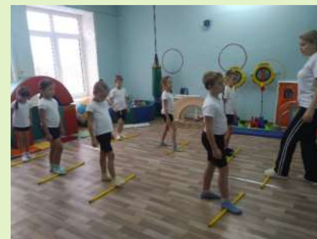
Прокатывание гимнастической палки