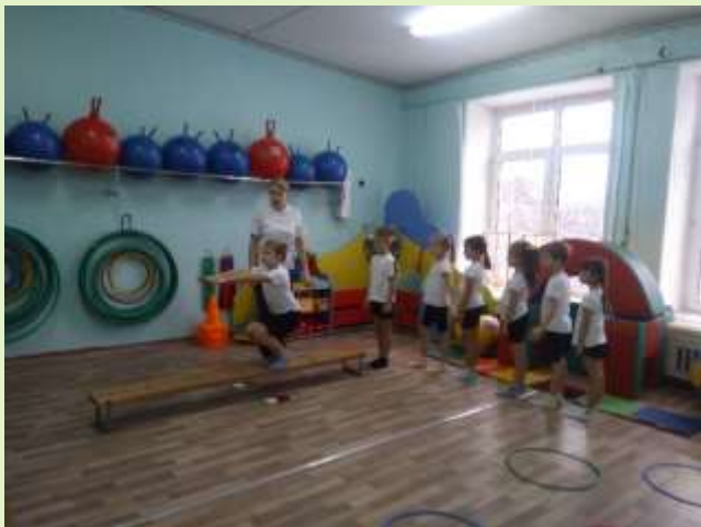
Ходьба с заданием