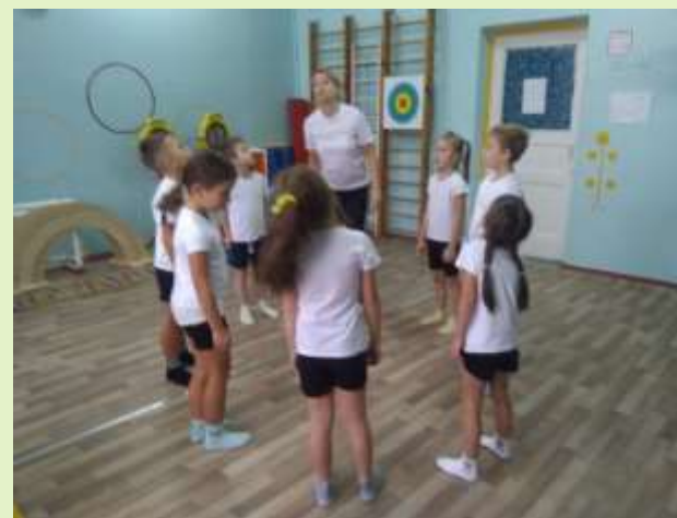
Дыханием рисуем облака