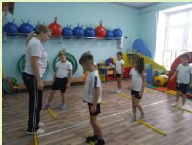
Ходьба по мостику