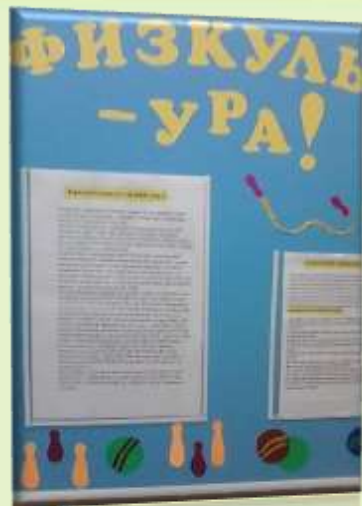
Наглядная информация для родителей