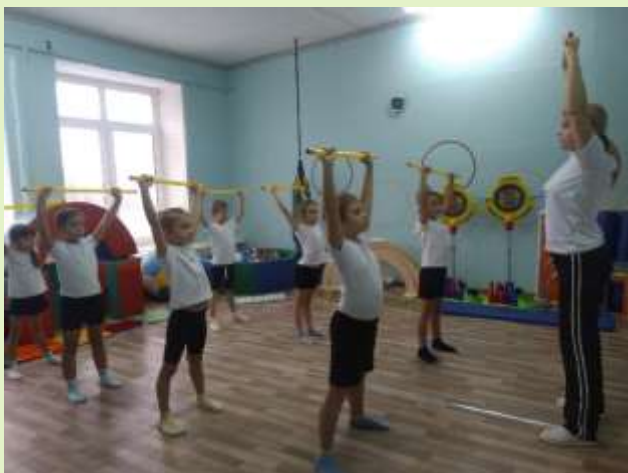
ОРУ с гимнастическими палками